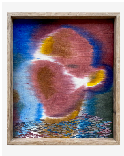
Sasha Huber: I See You / Koloniale Verflechtungen