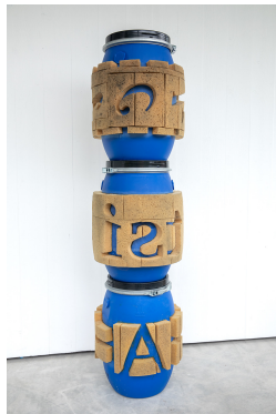
Pascal Lampert: Rollstempel